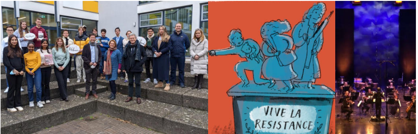
Illustration der drei Frauen in der Résistance von Ka Schmitz