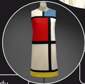
Mondrian cocktail dress, Yves Saint Laurent, Herbstkollektion 1965