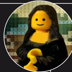
Lego Mona Lisa , Marco Pece, Fotografie und Lego, 2014, http://www.udronotto.it/