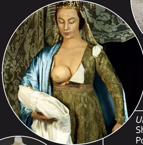
Untitled #216, Cindy Sherman, 1989 History Portraits Series