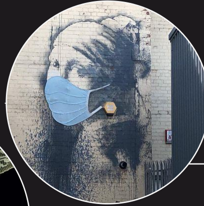
The Girl With a Pierced Eardrum , Banksy, 2015, Hafen von Bristol