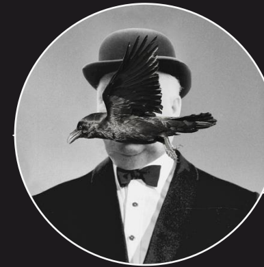
#magritte #hitchcock #birds, Dan Cretu, 2017, instagram-Fundstück