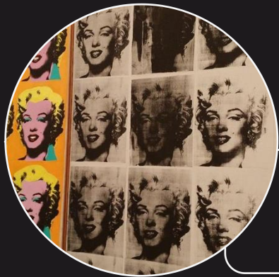
Marilyn Diptych, Andy Warhol, 1962, Acrylfarbe auf Leinwand, 205,44 x 289,56 cm